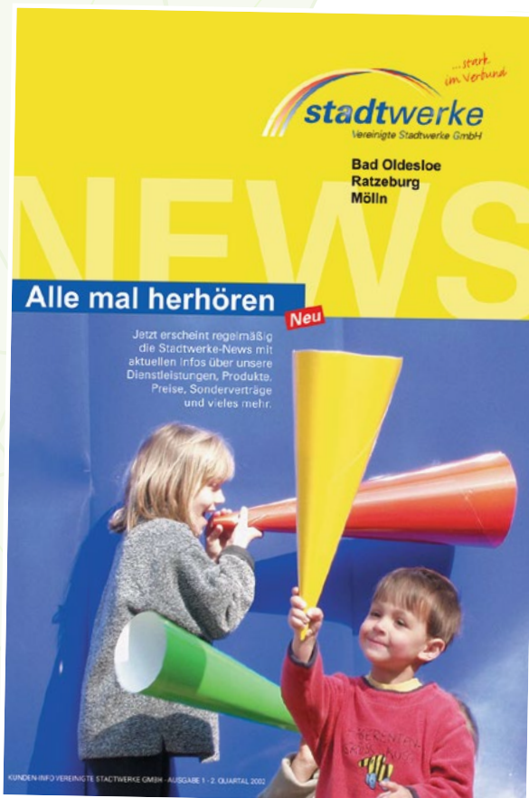
20 Jahre ist es her: In den „News“ konnten Kund:innen erstmalig Aktuelles aus dem frisch gegründeten Stadtwerke-Verbund lesen.

2020 Inbetriebnahme der ersten Schnellladesäulen