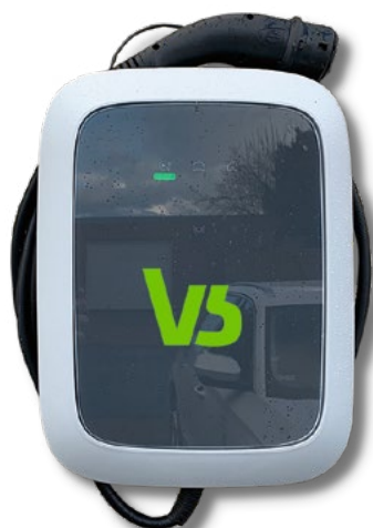
Ein echtes Multitalent ist die Wallbox für das smarte Zuhause.

Prüfen Sie auch Ihre Fördermöglichkeit über die KfW. Das staatliche Geldinstitut